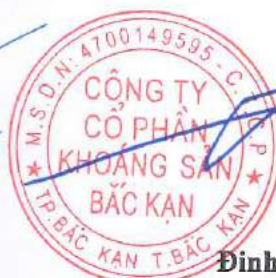
Đình Văn Hiến