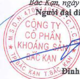
Đình Văn Hiến